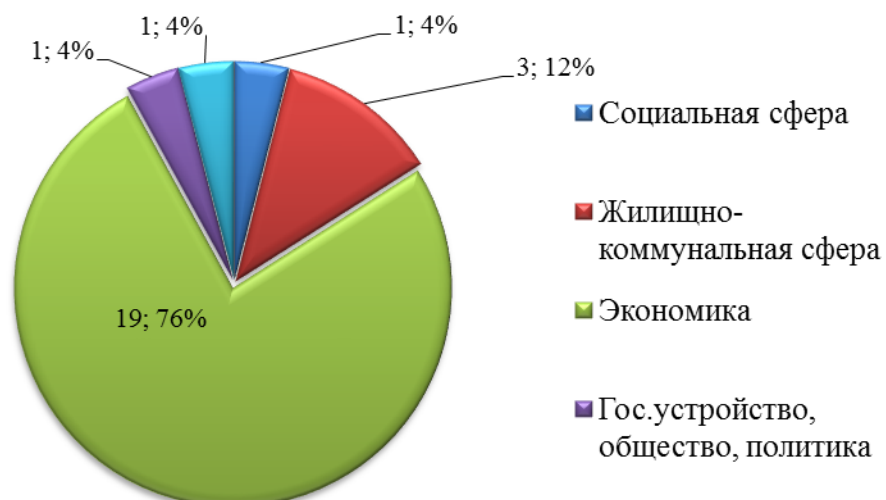
Количество письменных обращений по тематическим разделам за май 2017 года